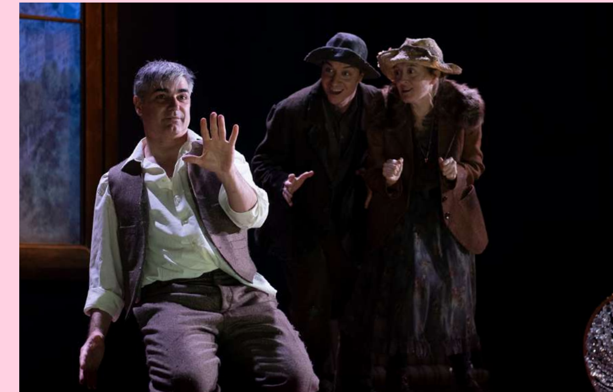
Nekrassov . Dirección: Dam Jemmett