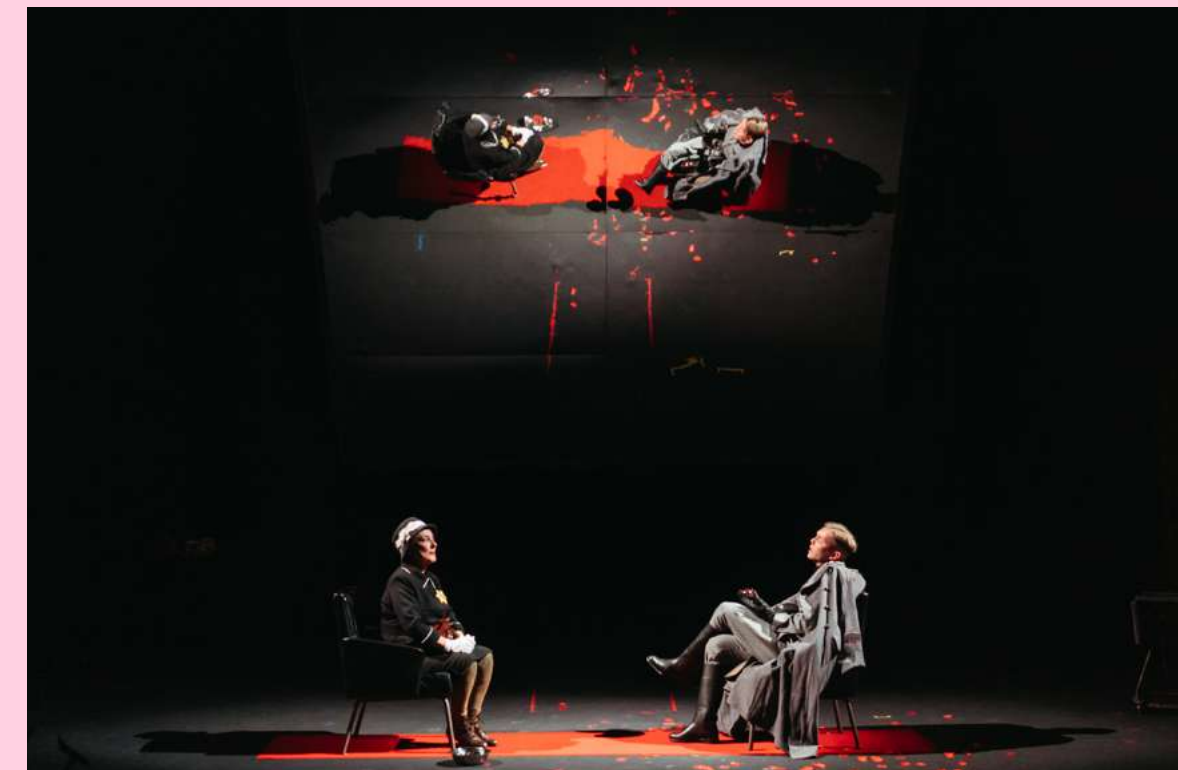
Coraje de Madre . Dirección: Helena Pimenta