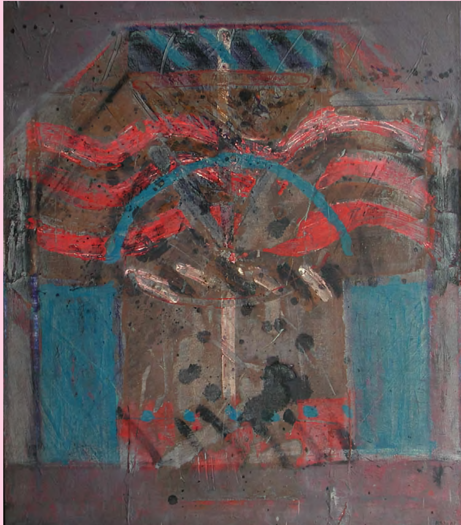
PIEZA DE VICENTE ROJO: VIEJA SENAL #2

Contemplada por mis oídos olida por mis ojos acariciada por mi olfato oída por mi lengua comida por mi tacto habitar tu nombre caer en tu grito contigo