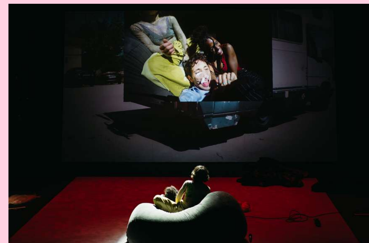
Cristo está en Tinder . Dirección: Rodrigo García