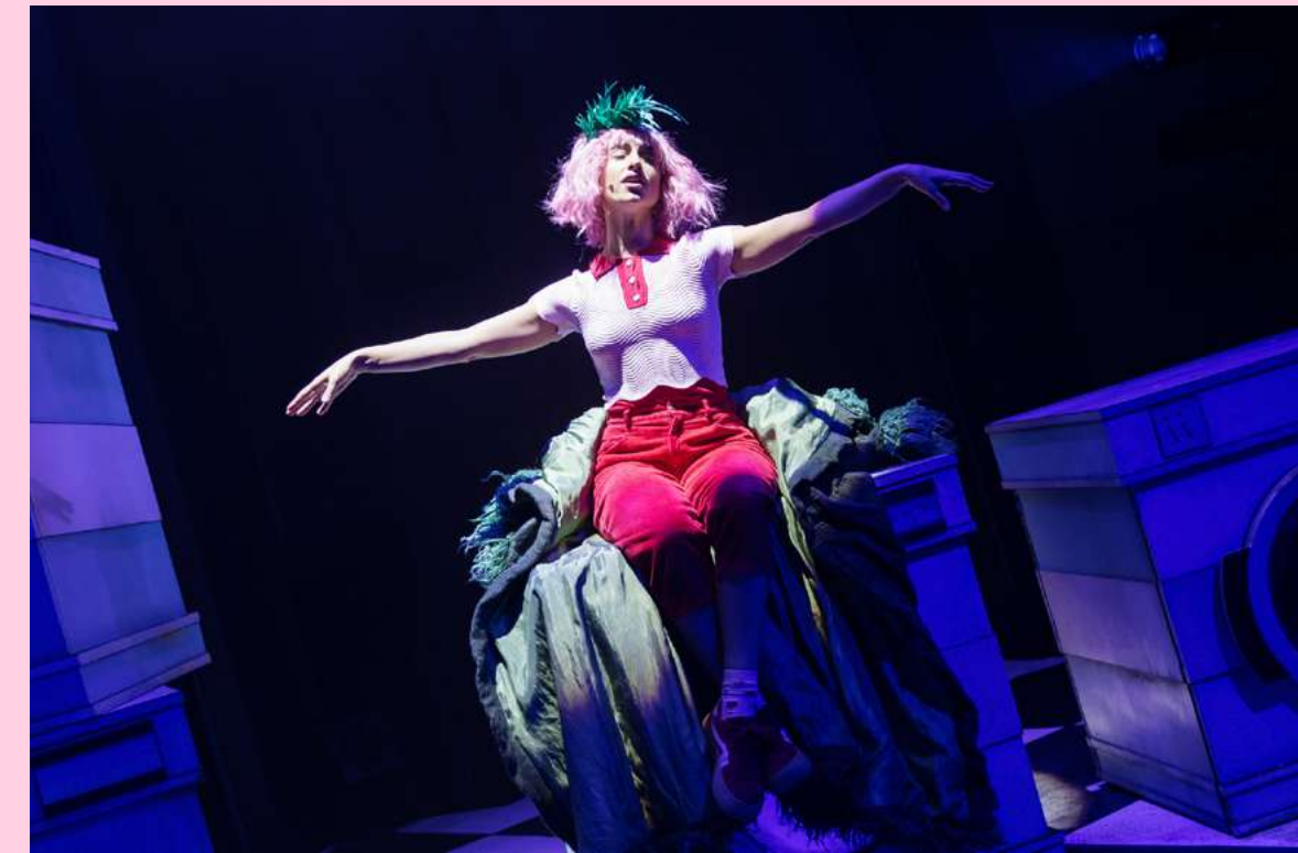
Caperucita en Manhattan . Dirección: Lucía Miranda