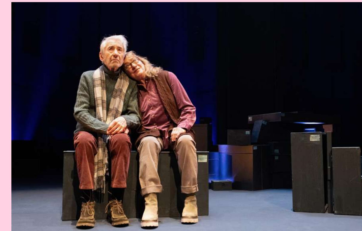
La colección . Dirección: Juan Mayorga