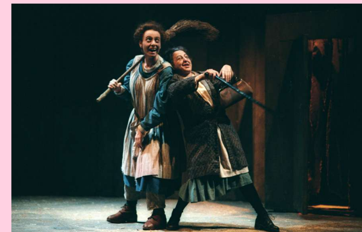
Retablo de la lujuria, la avaricia y la muerte . Dirección: José Luis Gómez