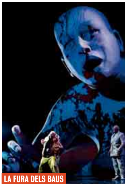
LA FURA DELS BAUS