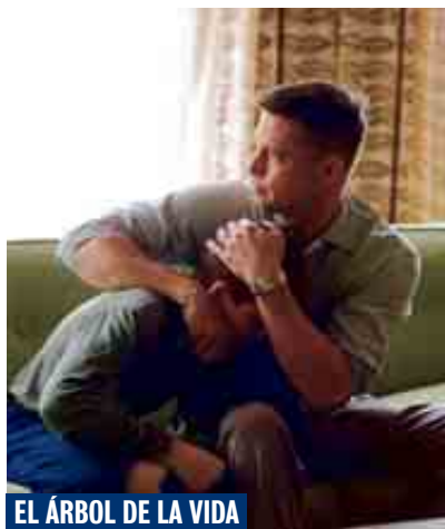
EL ÁRBOL DE LA VIDA