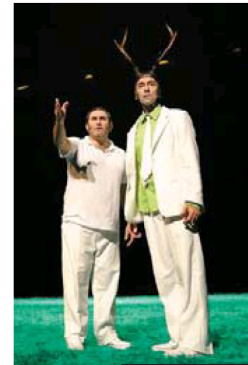
30/40 Livingstone se estrenó en catalán en 2011.

¿En qué idioma prefiere trabajar? Escribo en catalán, pero siento igual en francés, catalán o castellano. Esta obra la he representado en los tres idiomas y no hay diferencias. Nuestro teatro tiene pretensión de ser popular, de llegar a la gente. No soy un intelectual elitista: hago teatro para que mi madre venga a verlo.