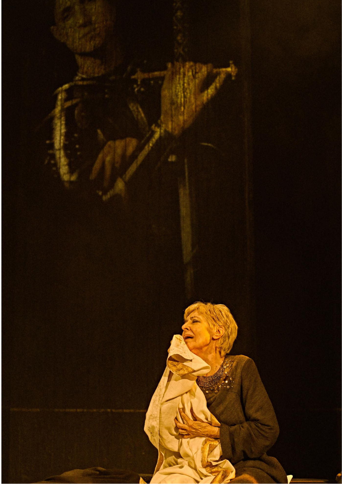
La Abadía – "Reina Juana"