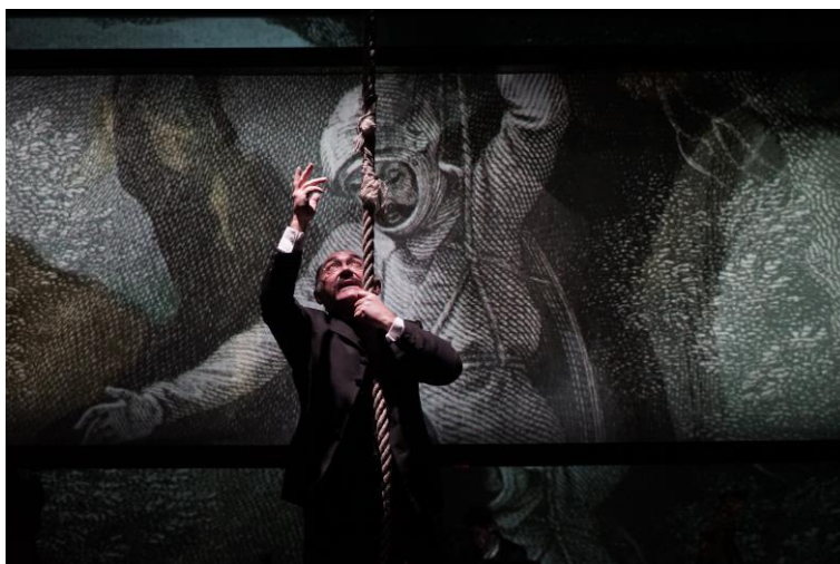
La Abadía – "La ruta de Don Quijote"