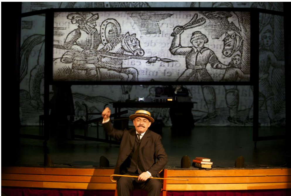
La Abadía – "La ruta de Don Quijote"