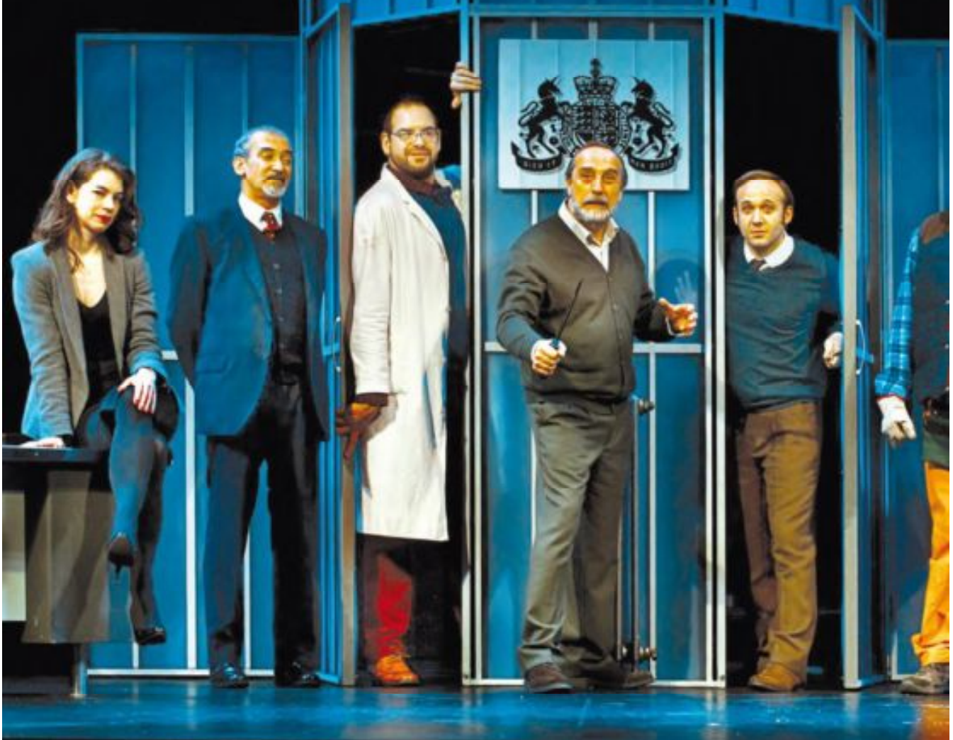
El reparto al completo.