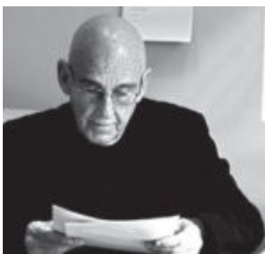
José Sanchis Sinisterra.