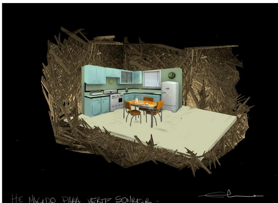
La Abadía - "He nacido para verte sonreír"