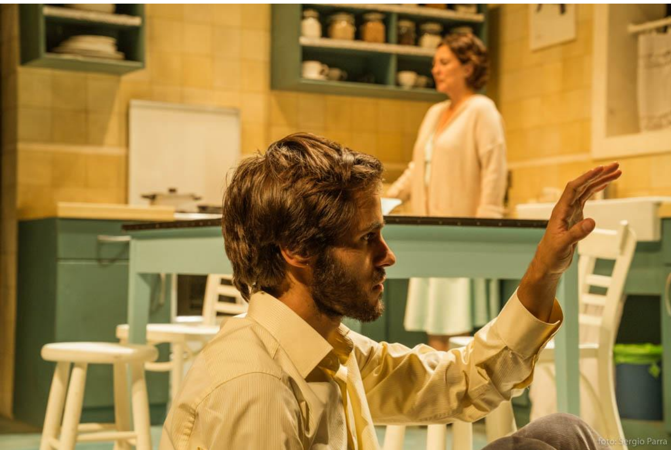
La Abadía - "He nacido para verte sonreír"