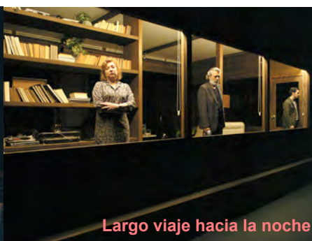
Largo viaje hacia la noche