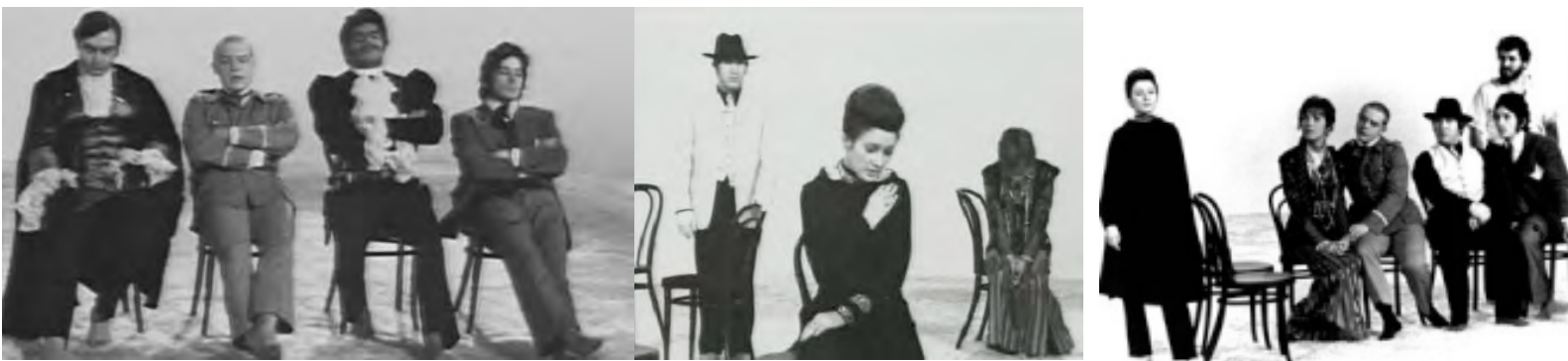
El café Bremen 1969

Sus obras más conocidas son Anarquía en Baviera (1969), Katzelmacher (1968), Libertad de Bremen (1971), Sangre en el cuello del gato (1971) y Las amargas lágrimas de Petra von Kant (1971).