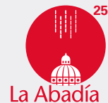
Imagen gráfica: Ángela Bonadies, Marra Vega y Cecilia Molano.