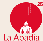
Imagen gráfica: Ángela Bomadies, Marta Vega y Cecilia Molano.