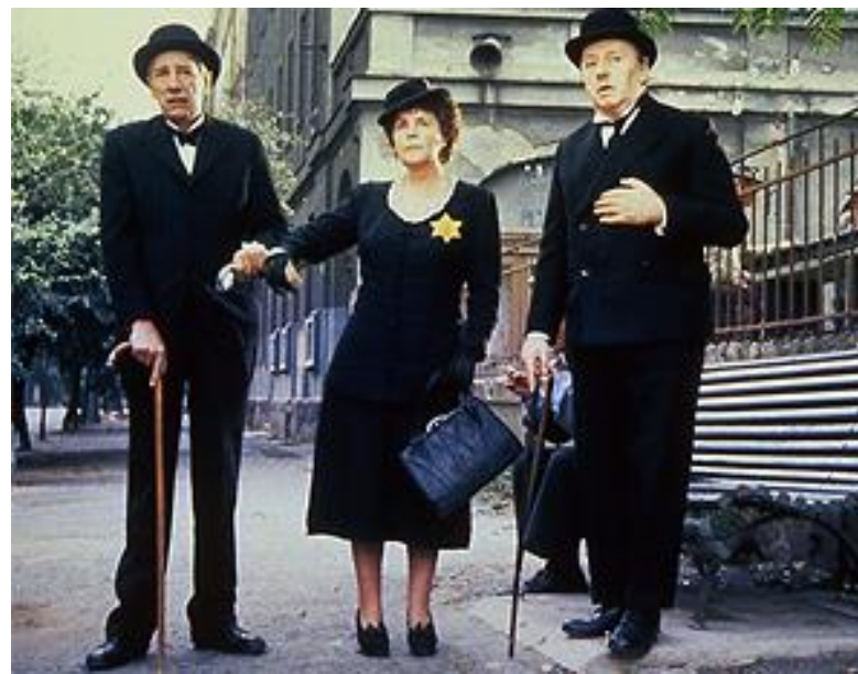
Imagen de la película de Verhoeven

La obra se estrenó en 1979 en Múnich, en la Münchner Kammerspiele, con dirección de Tabori y con Hanna Schygulla en el personaje de la madre. Más tarde, en 1995, fue adaptada al cine, por Michael Verhoeven, con el propio Tabori en el papel del hijo/narrador y Pauline Collins como la madre.