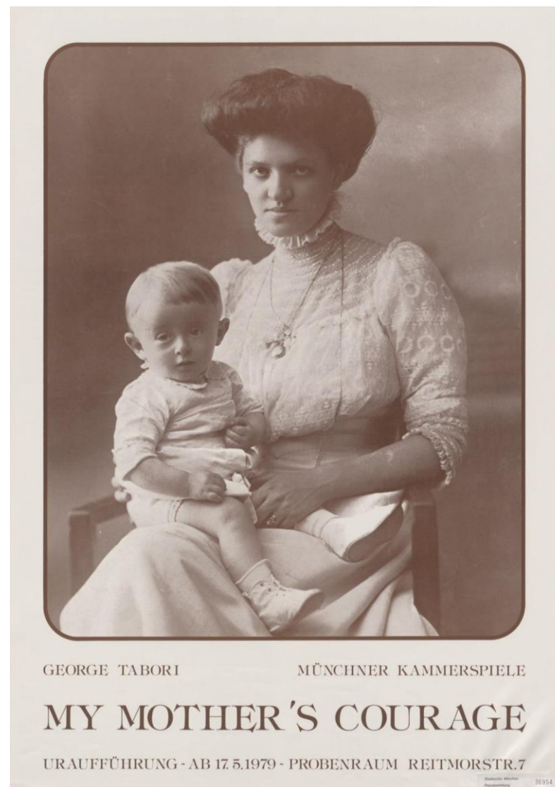
Cartel del estreno original, en Múnich

Cuando volvió a ver a su madre, al año siguiente, la vio muy distinta de como la recordaba: había perdido la mayor parte de su familia y se negaba a hablar del reciente pasado. «Antes era muy cálida y cariñosa. Una mujer dulce, una madre de verdad