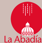
Imagen gráfica: Ángela Bonadies, Marta Vega y Cecilia Molano.